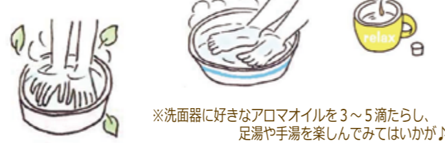
※洗面器に好きなアロマオイルを3～5滴たらし、足湯や手湯を楽しんでみてはいかがでしょうか！

マグカップや洗面器にお湯を張り、お好みのアロマオイルを1～3滴たらして、その湯気を鼻からゆっくり吸うのも良いですよ。